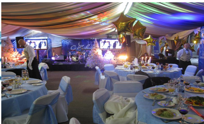
Шатры с декором – 300 кв.м.