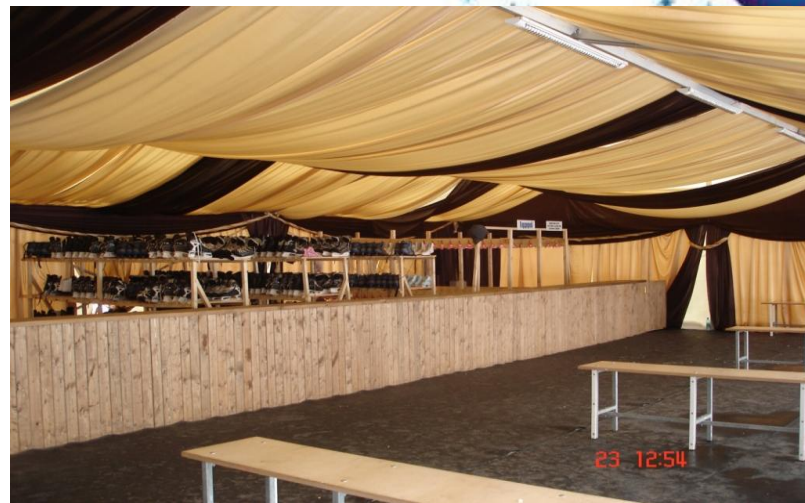
Теплая VIP-раздевалка и прокат коньков