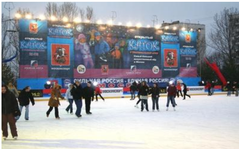
Большая площадь катка